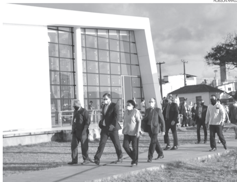
Estados Unidos cooperarão com a formatação do museu do complexo cultural potiguar

“É uma grande honra estar aqui celebrando esse fato. Penso que é necessário que se tenha, ao menos, uma exposição da História americana aqui