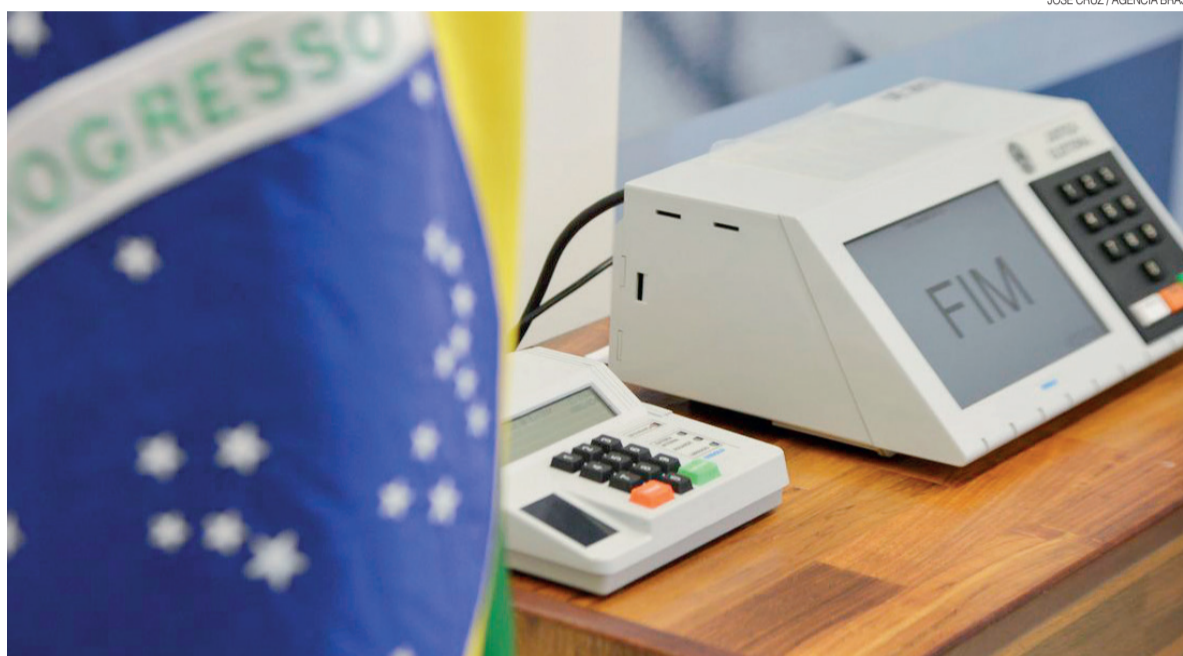
Eleitores vão às urnas no dia 15 de novembro para escolher novos prefeitos, vice-prefeitos e vereadores em mais de 5 mil municípios

A Justiça Eleitoral, porém, formulou regras para a campanha online, que deverão ser observadas rigorosamente pelos partidos, candidatos