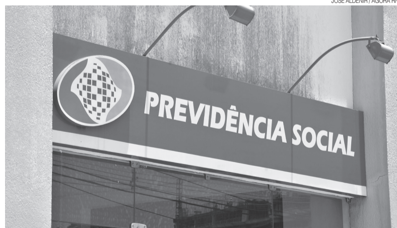
Agências retomaram atendimentos, mas peritos não compareceram por alegar falta de estrutura

E, mesmo após o retorno das atividades, cerca de 200 mil processos estão paralisados aguardando perícia.