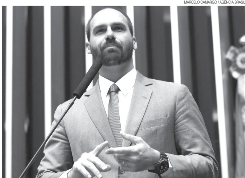
MARCELO CAMARGO / AGÊNCIA BRASIL

Confrontado pela PF sobre sua declaração, o filho do presidente afirmou que “foi uma análise de um cenário e não uma defesa de ideia, que a frase está na esfera de cogitação futura e incerta, que inexistente qualquer tipo de organização voltada para a subversão