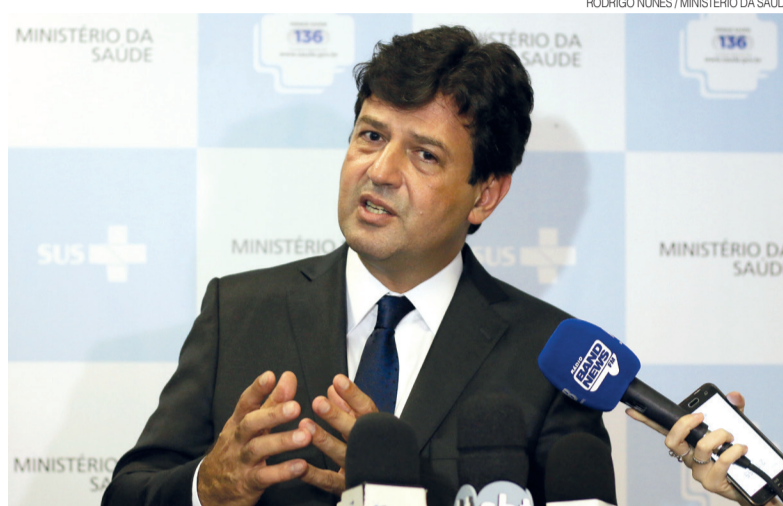
Mandetta deixou Ministério da Saúde em meio à pandemia após divergências com Bolsonaro

Médico ortopedista e ex-deputado federal, Mandetta foi o primeiro ministro da Saúde do governo Bolsonaro. Foi empossado no cargo em janeiro de 2019 e permaneceu ministro até 16 de abril deste ano, quando foi demitido em razão das divergências