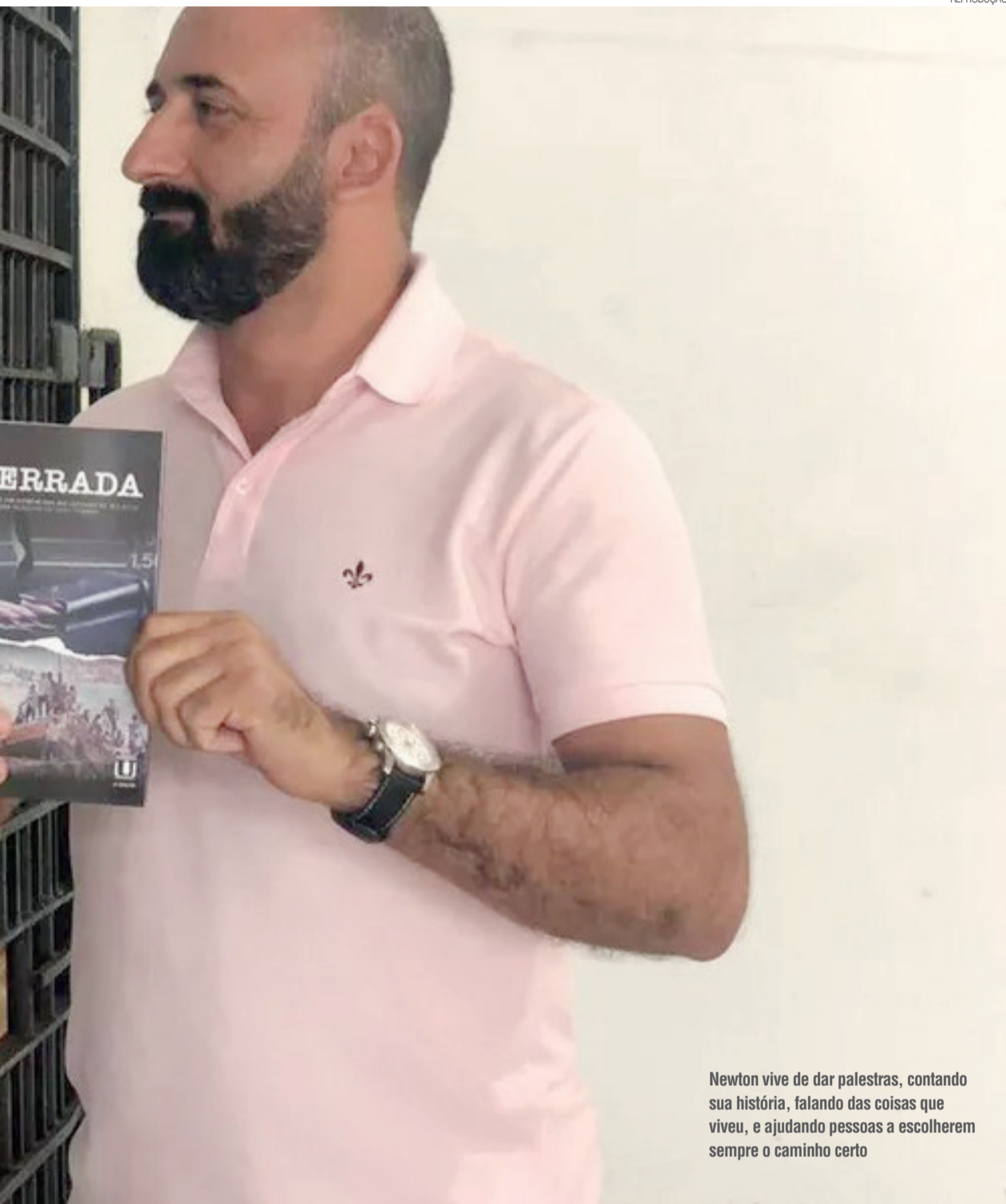
Newton vive de dar palestras, contando sua história, falando das coisas que viveu, e ajudando pessoas a escolherem sempre o caminho certo