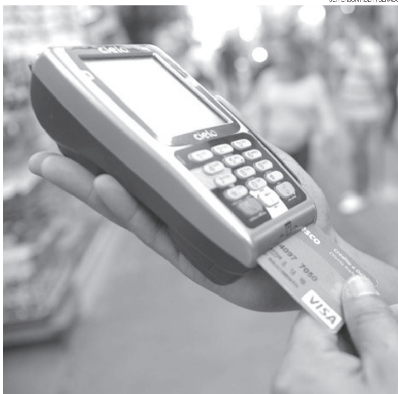
Operadoras de cartão de crédito terão de pagar imposto no local onde serviço foi prestado

Os serviços que terão a arrecadação transferida para o destino são os de planos de saúde e médico-veterinários;