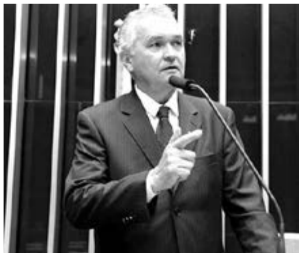
Deputado federal General Girão (PL)