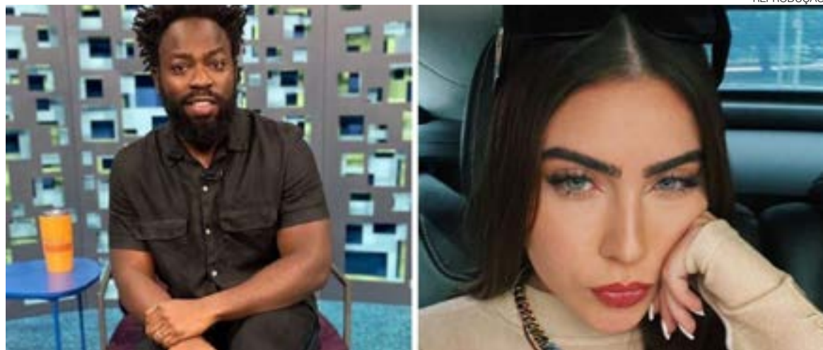
Ator, que foi terceiro colocado no BBB22, aprovou escalção de Jade Picon e afirmou que pode alavancar audiência

Vale lembrar, por fim, que a participação de Jade causou a maior polêmica nas redes sociais. Nomes como Murilo Rosa, Carlos Vereza, Ana Hikari, Ana Rita Cerqueira e Nina Tomsic criticaram a decisão da emissora. ●