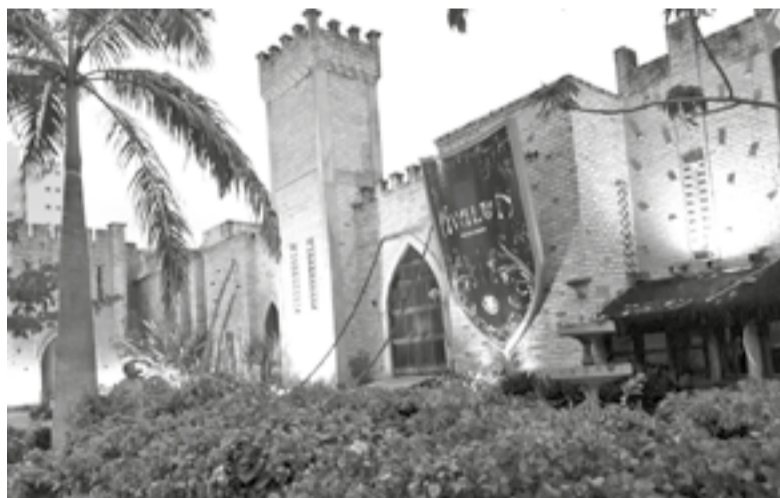
Inaugurado em 1995, Castelo Lua Cheia se consolidou como ponto turístico