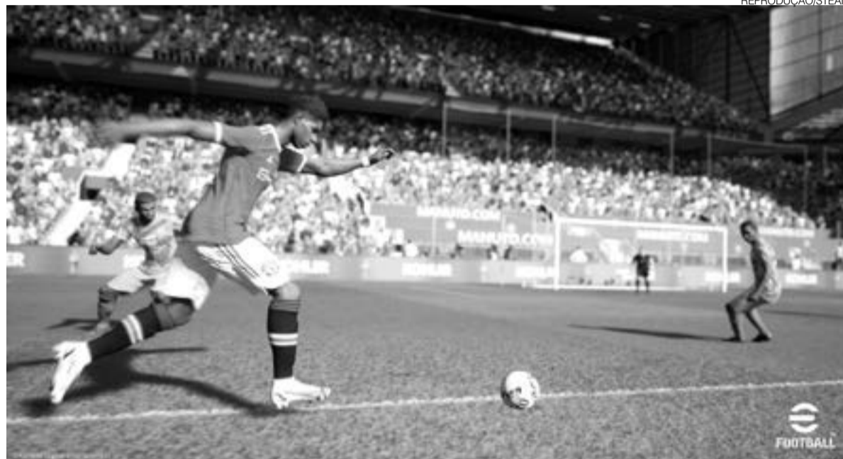
eFootball 2022 chegará finalmente para dispositivos mobile junto com nova atualização em 2 de junho

O game teve um lançamento conturbado em setembro de 2021 e passou por mudanças estruturais nos gráficos e na gameplay com o patch de abril. A partir disso, a jogabilidade foi consertada e os desenvolvedores prometeram reconquistar a confiança dos fãs. Além de dispositivos móveis, o rival do FIFA 22 seguirá disponível para PlayStation 4 (PS4), PlayStation 5 (PS5), Xbox One,