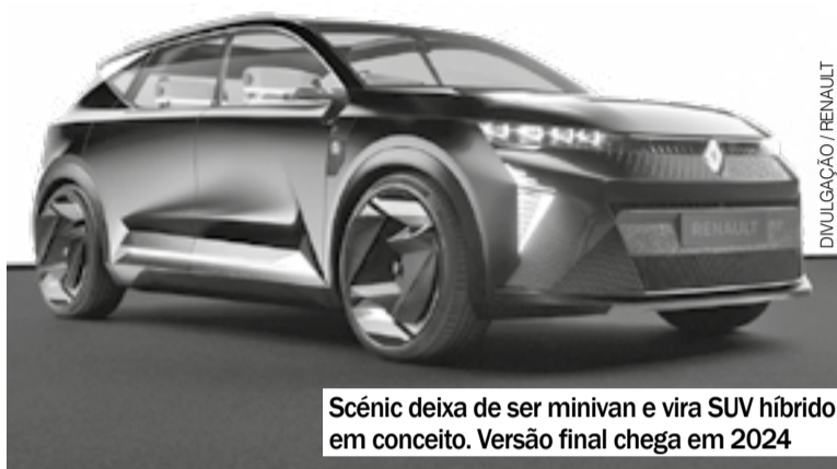
Scénic deixa de ser minivan e vira SUV híbrido em conceito. Versão final chega em 2024

Modelo que traz até reconhecimento facial faz parte de plano ambiental para neutralizar carbono na Europa até 2040. Versão definitiva chega em 2024