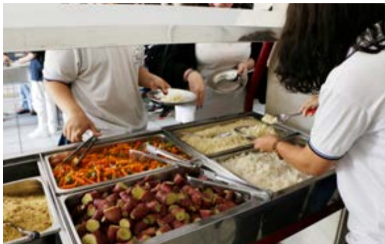
Estado chegou a investimento de R$ 22 milhões para alimentação escolar

Diante desse quadro, o Governo do RN realiza, com recursos próprios, a complementação do repasse, com valores maiores do que os utilizados pelo Governo Federal. A distribuição desta verba sofre alterações conforme a