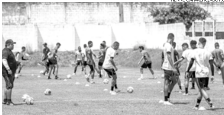
Equipe alvinegra segue trabalhando forte, buscando o acesso para Série B

ABC e Atlético-CE medem forças pela 7ª rodada da Série C do Brasileirão 2022. A partida será disputada, neste sábado 21, às 17 horas, no estádio Ronaldão, em Pacajus-CE. O alvinegro potiguar está no G-8 e deve ir em busca da vitória para avançar na tabela e conquistar vaga para a Série B. Já o Atlético cearense, que surpreendentemente, conquistou 4 pontos em seus últimos dois jogos disputados, ainda está na zona de rebaixamento da terceira divisão do