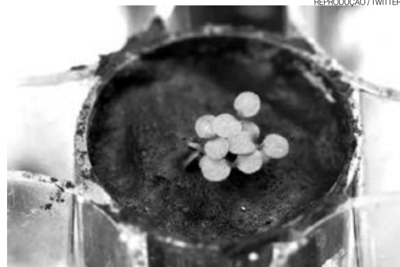
Mudas foram menores e cresceram mais lentamente, por outro lado