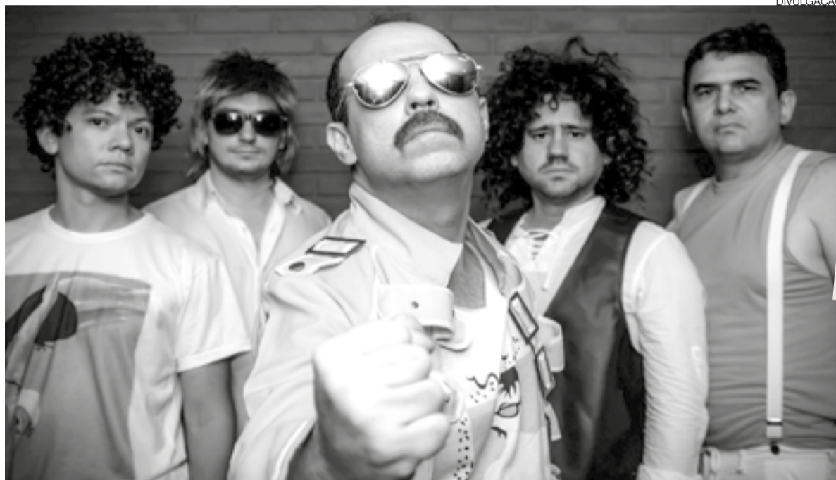
Banda cearense “Killer Queen” faz cover da banda inglesa há 18 anos e vem a Natal para show no largo do castelo

Muito tradicional também para turistas, a casa abre de quarta a segunda e já recebeu 7.500 shows de música ao vivo e mais de 800 mil visitas de clientes. Por sua aparência curiosa, e também