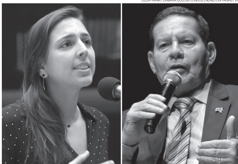
Deputada federal Natália Bonavides (PT-RN) e vice-presidente da República, Hamilton Mourão

“Digo isso porque já morei nos Estados Unidos. Racismo tem lá”, argumentou Mourão ao negar a existência do racismo no Brasil. “Aqui existe desigualdade. Fruto de uma série de problemas”, completou.