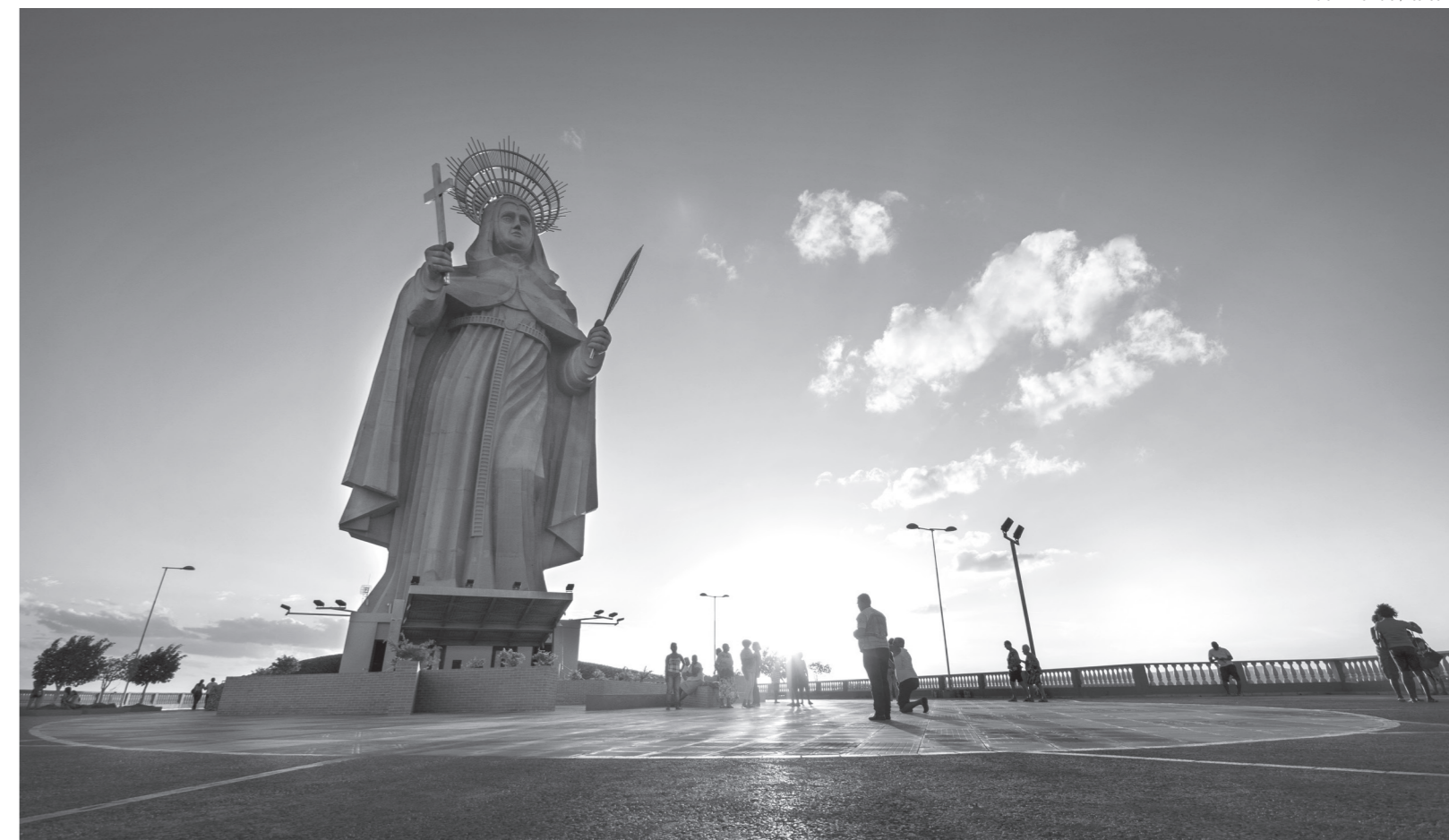
Retomada se explica pela melhoria dos índices relacionados com a crise sanitária da Covid-19 e também pelas políticas públicas do Governo do Rio Grande do Norte em reativar a cadeia turística

Uma das respostas para esta medida está no anúncio da Azul Linhas Aéreas de retornar voos regulares