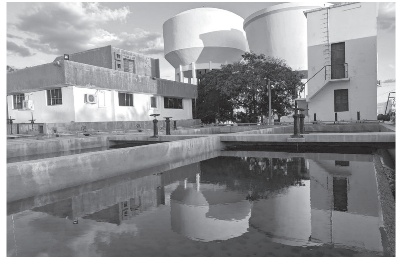
Investimentos no sistema via adutora Manoel Torres e o envio de água do sistema Coremas mudaram a realidade no abastecimento hídrico do município de Caicó

Esta melhoria no abastecimento é resultante de um bom inverno que propiciou uma boa recarga do Açude Coremas, responsável pela perenização do rio Piranhas. E, também, dos investimentos realizados nos últimos anos no Sistema de Abastecimento de Água no município. Foram inves-