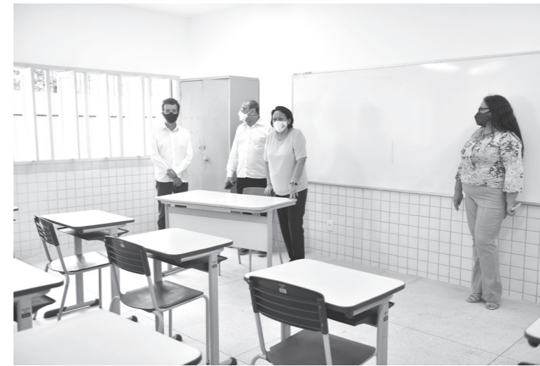
Governo do Estado promoveu diversas ações para garantir educação de qualidade aos alunos

Diante da pandemia, o Governo do Rio Grande do Norte promoveu diversas ações para garantir