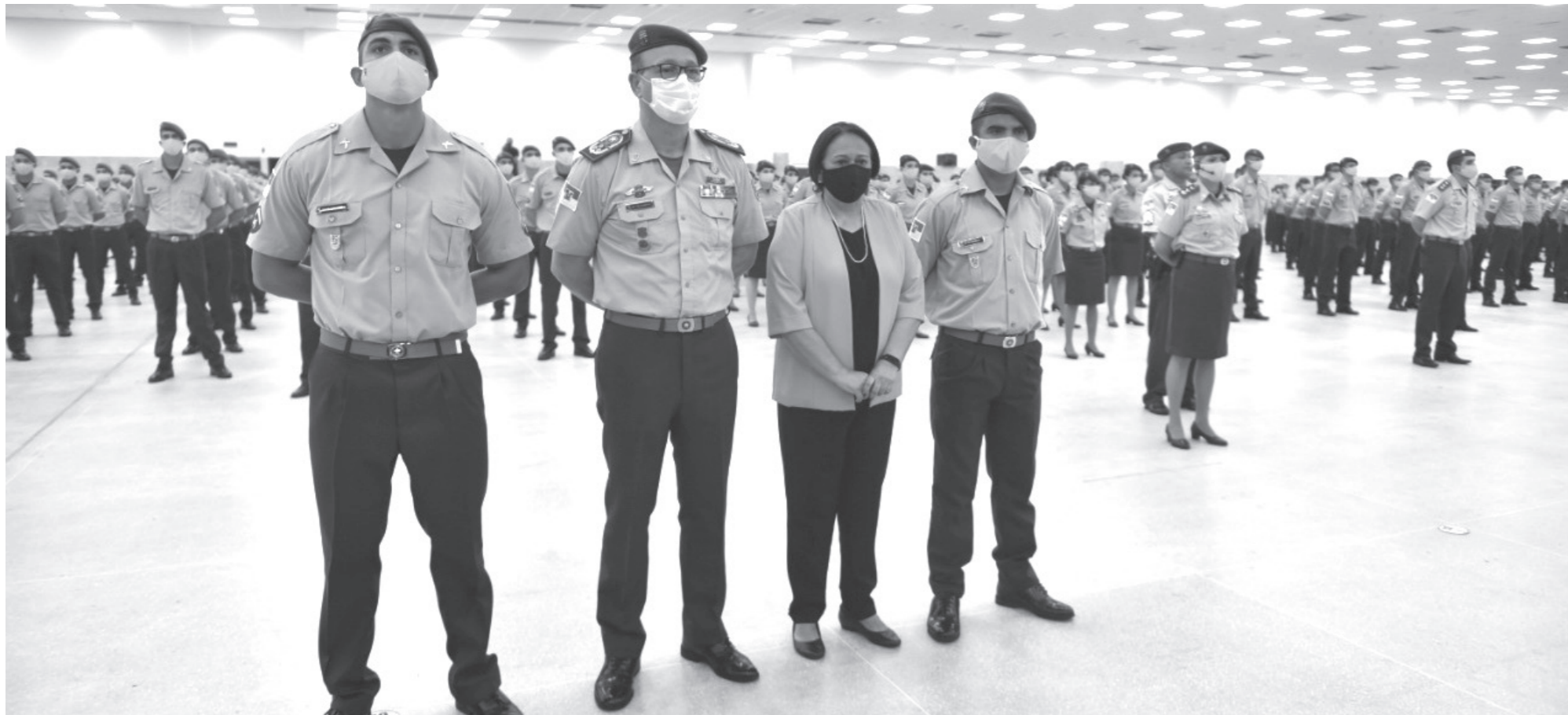
Governadora Fátima Bezerra disse que o reforço dos novos policiais militares representa um “marco histórico” para a segurança pública do Rio Grande do Norte: “Estão prontos para combater a violência e a criminalidade”