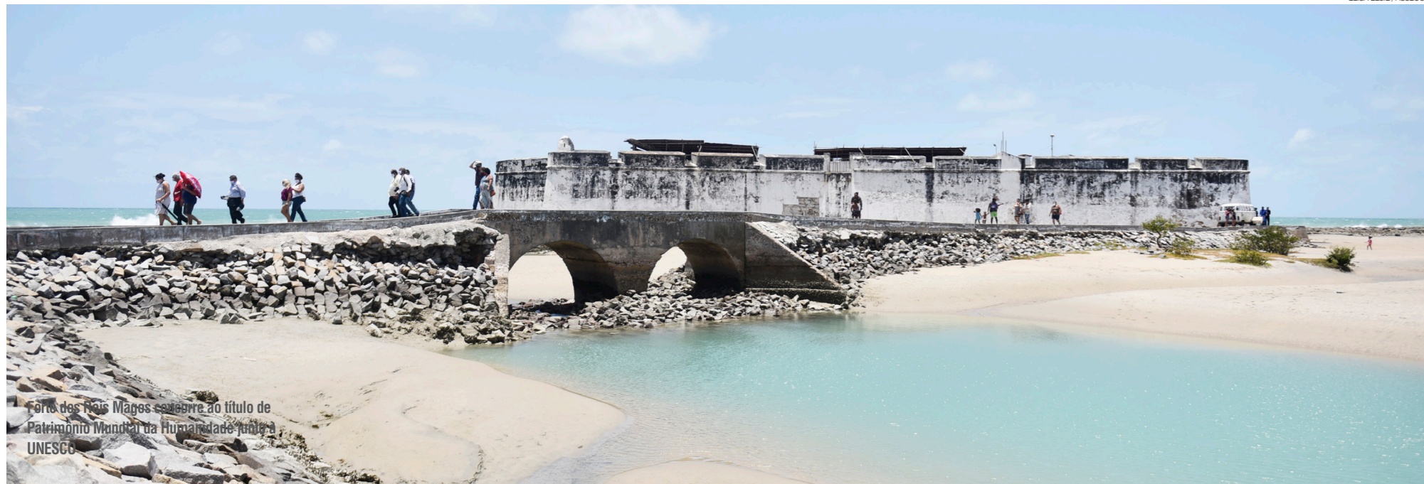
Forte dos Reis Magos esboça o título de Patrimônio Mundial da Humanidade pela UNESCO