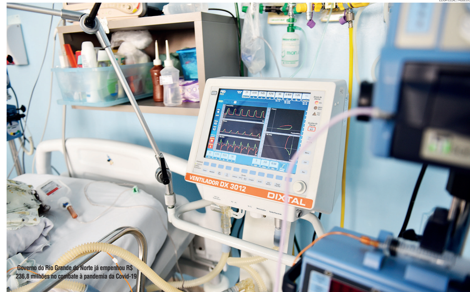
Governo do Rio Grande do Norte já empenhou R$ 236,8 milhões no combate à pandemia da Covid-19