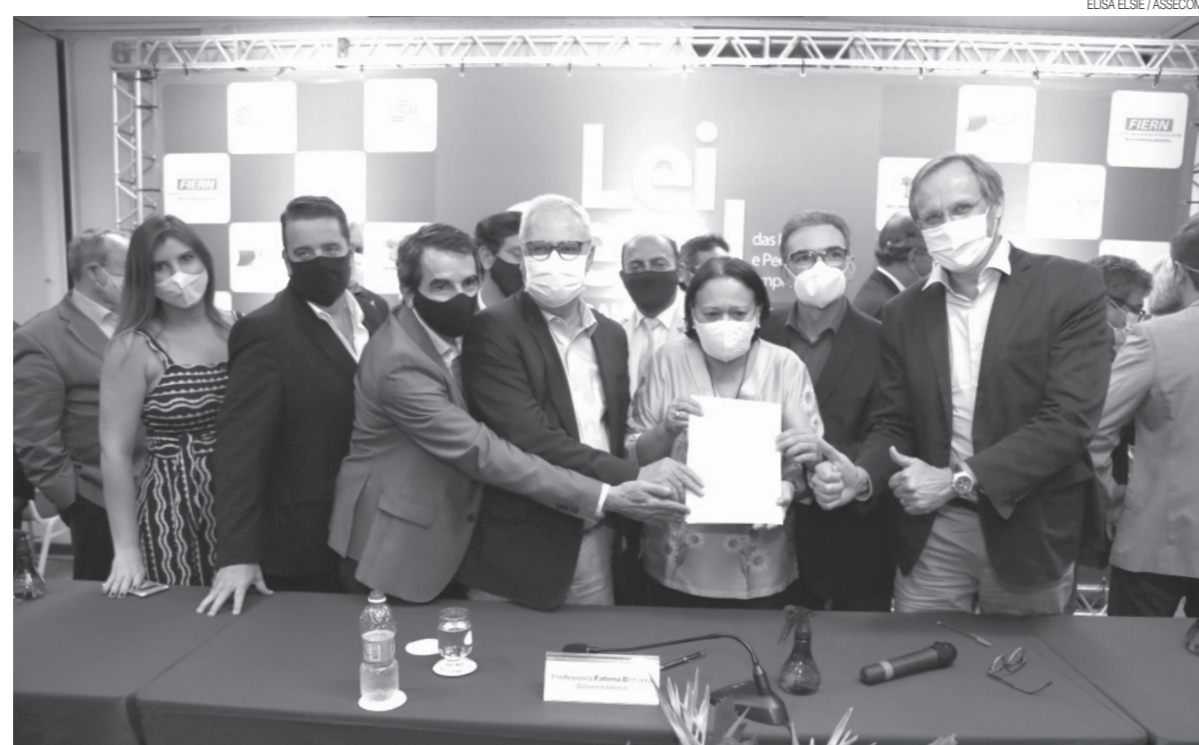
Governadora Fátima Bezerra avalia que a lei das micro e pequenas empresas é moderna e vai impactar o setor que mais gera empregos no RN

O diretor nacional do Sebrae também considerou que a lei “vai construir o Rio Grande do Norte e repercutir junto aos demais estados”. Não é pouca coisa. É de muita relevância para a construção da nação brasileira. Parabéns à governadora! Esta lei é um marco que pode e deve