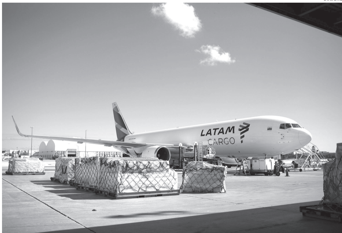
A rota de cargas também pode favorecer a companhia aérea com a importação de peças e componentes para os parques eólicos

Hoje, 85% das exportações de atum do Brasil são realizadas a partir do RN. A rota de cargas também pode