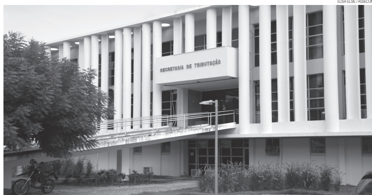
Pelos cálculos da Secretaria de Estado da Tributação (SET), a expectativa é recuperar pelo menos R$ 30 milhões dos contribuintes com débitos

“Esse novo Refis representa uma oportunidade para aqueles contribuintes que acabaram acumulando débitos de ICMS durante a pande-