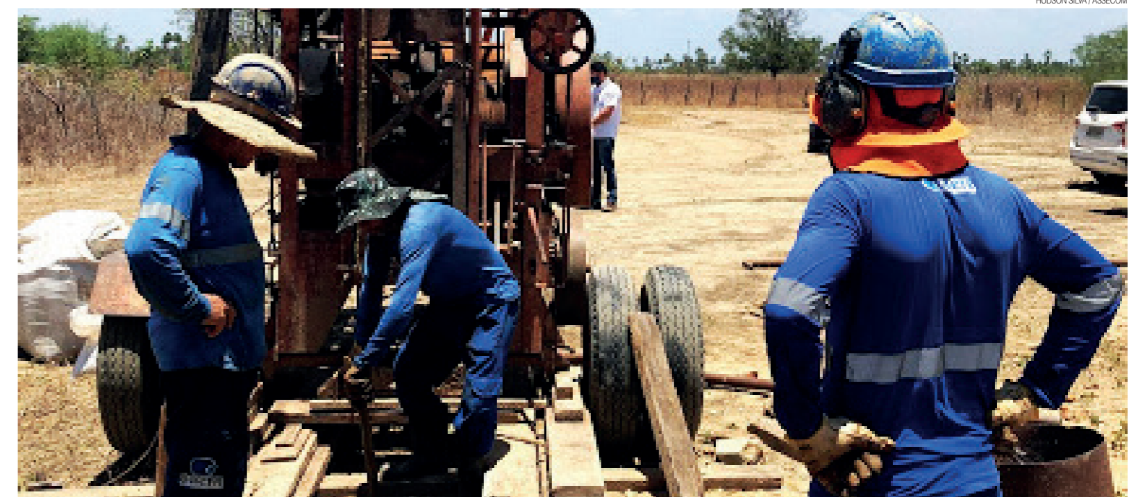
O RN+Água não fica apenas na instalação da infraestrutura para levar água de qualidade. O programa também contempla investimentos em educação para conscientizar sobre uso e reuso da água

O RN+Água é uma ação multisetorial do Governo. Vão atuar, sob a coordenação da Secretaria de Estado do Meio Ambiente e dos Recursos Humanos (Semarh), a Companhia de Águas e Esgotos do RN (Caern), as