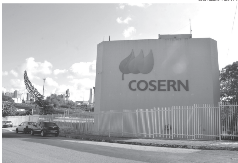
Cosern informou que conta com 68 subestações espalhadas por todo o Rio Grande do Norte

A empresa do RN foi vendida em leilão de privatização em 1997 e adquirida pelo consórcio formado pela