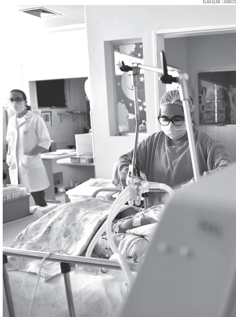
Procedimentos eletivos no hospital pediátrico retomaram no dia 21 de outubro

Já as crianças que ainda não passaram por avaliação do cirurgião estão em fase de encaminhamento via regulação municipal e estadual. Além disso, as crianças que precisam de internação são encaminhadas para os leitos de clínica cirúrgica e são acompanhadas pela equipe multiprofissional até sua alta.