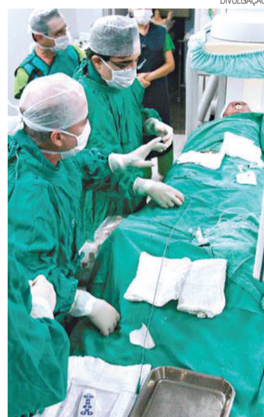
Reajuste será dividido em 12 meses

De acordo com a ANS, a suspensão do aumento alcançou 20,2 milhões de beneficiários, no caso do reajuste anual por variação de custos, que representam 51% do total de beneficiários em planos de assistência médica regulamentados sujeitos a esse tipo de reajuste.