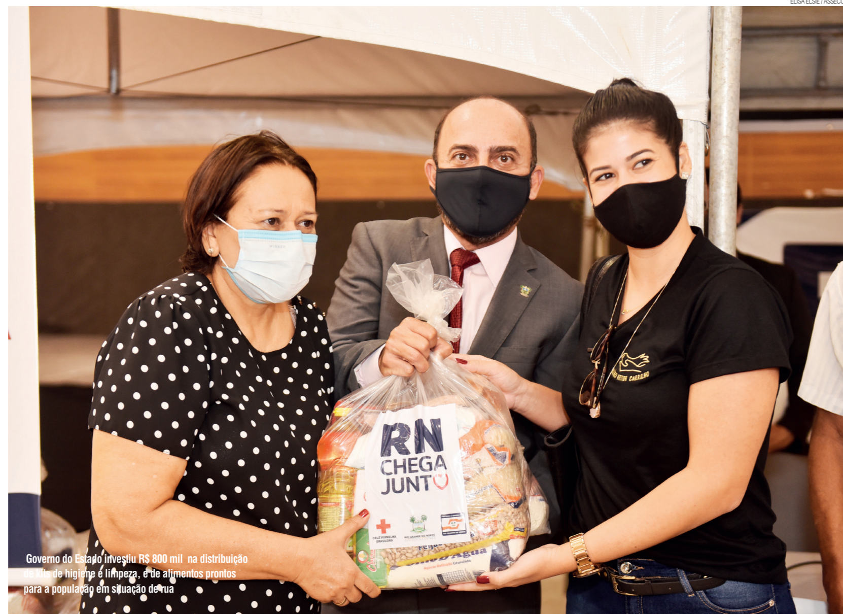
Governo do Estado investiu R$ 800 mil na distribuição de kits de higiene e limpeza, e de alimentos prontos para a população em situação de rua

blicou a cartilha de proteção social para a pessoa idosa no SUAS, cartilha do Plano Estadual de Erradicação do Trabalho Infantil com atividade virtual, capacitação para gestores e trabalhadores do SUAS nos municípios dentro do Programa Criança Feliz.