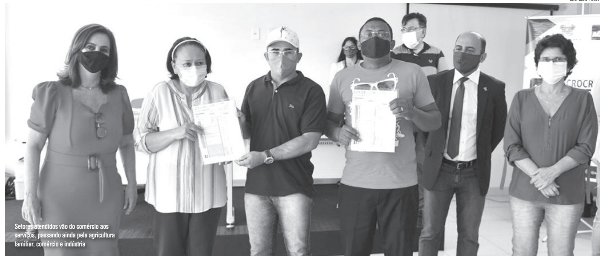
Setores atendidos vão do comércio aos serviços, passando ainda pela agricultura familiar, comércio e indústria

es a 31 de julho de 2020 referentes aos impostos sobre Operações relativas à Circulação de Mercadorias e Prestação de Serviços de Transporte Interestadual e Intermunicipal e de Comunicação (ICMS) e sobre a Propriedade de Veículos Automotores (IPVA). Também podem solicitar a adesão ao Refis empresas que estão em processos de cobrança judicial, o que deverá abreviar o tempo de negociação, já que os procedimentos são simplificados, dispensando os questionamentos e impugnações comuns em processos jurídicos.