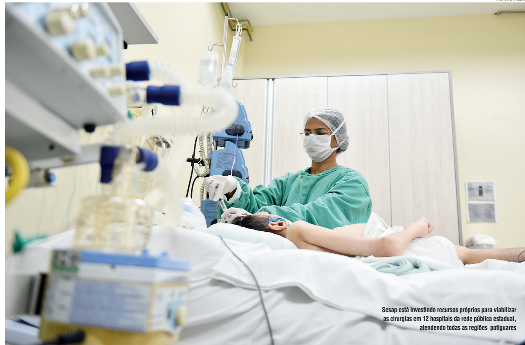
Sesap está investindo recursos próprios para viabilizar as cirurgias em 12 hospitais da rede pública estadual, atendendo todas as regiões potiguares