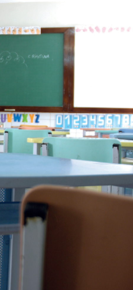
só serão retomadas em 2021