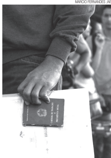
Desemprego foi de 15,8% entre pretos e pardos

Ainda no segundo trimestre, houve uma redução de 24,6% nas vagas para trabalhadoras domésticas, que também concentram a população negra.