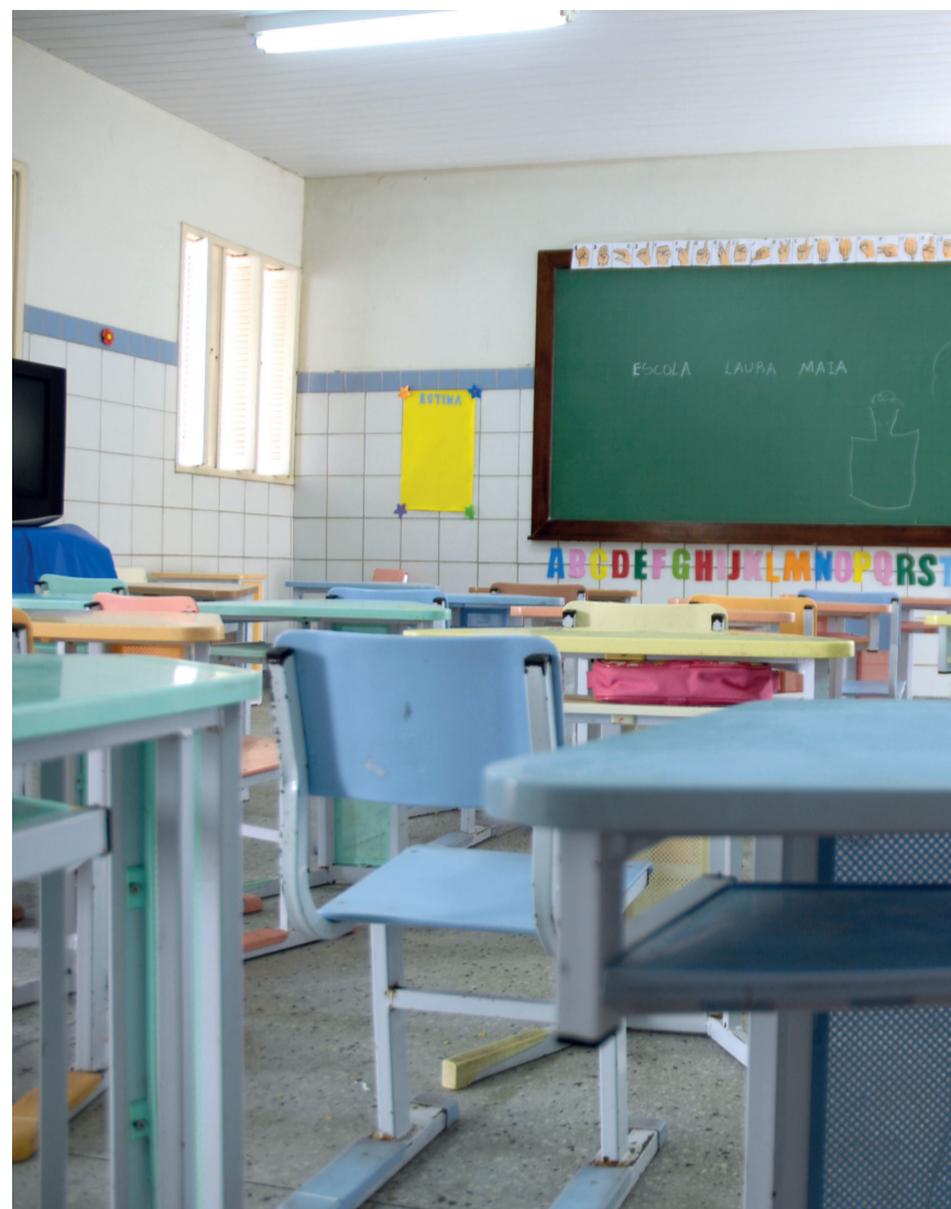
Aulas presenciais nos Centros Municipais de Educação Infantil (CMEI) e em todas as escolas municipais

O prefeito Álvaro Dias (PSDB) decidiu suspender o calendário da rede pública municipal de ensino em setembro. Com a medida, as aulas pre-