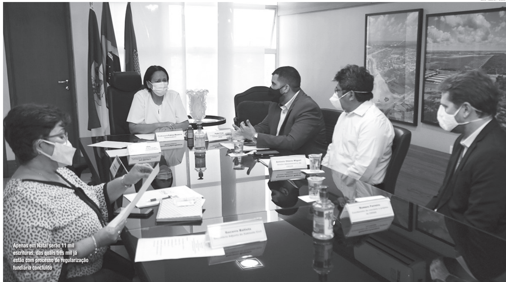
Apenas em Natal serão 11 mil escrituras, das quais três mil já estão com processo de regularização fundiária concluído