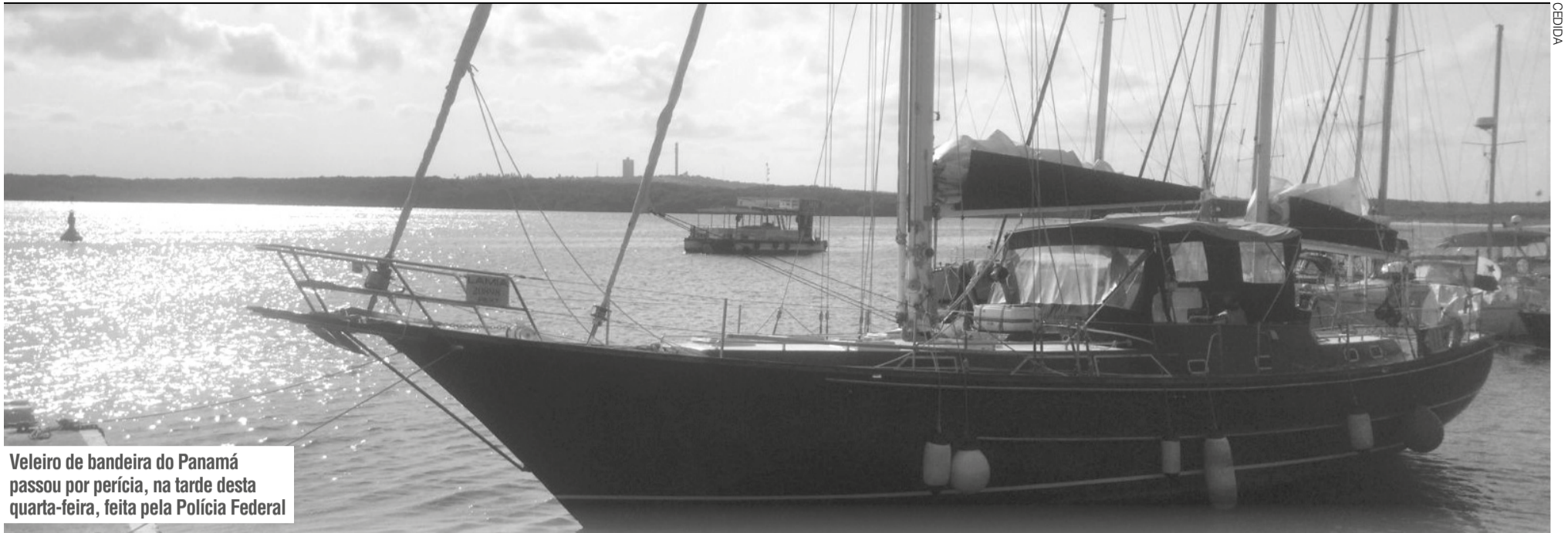
Veleiro de bandeira do Panamá passou por perícia, na tarde desta quarta-feira, feita pela Polícia Federal