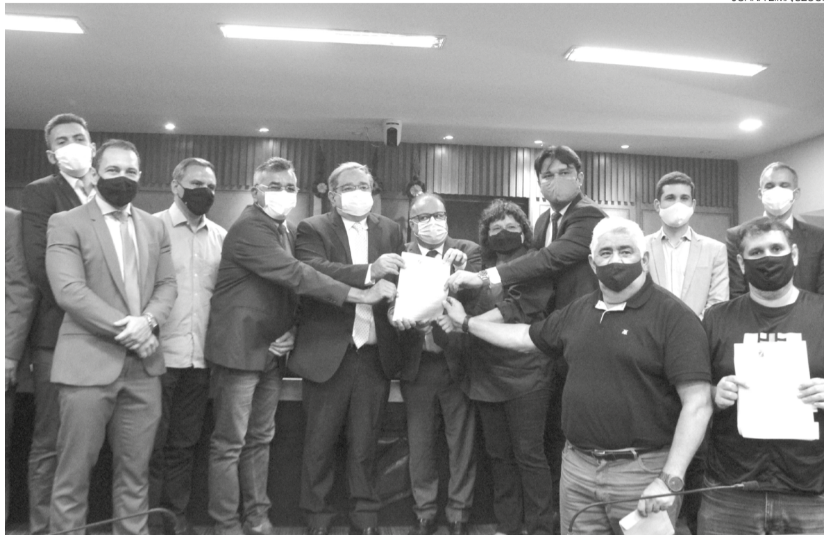
Prefeito Álvaro Dias, em gesto de valorização à Câmara, foi ao Legislativo Municipal pessoalmente entregar projeto

“Se for possível votar ainda em 2021, vamos votar. Mas não vamos votar a toque de caixa. Faremos uma coisa democrática e transparente para um plano equilibrado que traga desenvolvimento para a cidade e que contemple a preservação ambiental e o desenvolvimento urbano. Teremos uma comissão especial que ordenará os trabalhos na casa com audiências todas as sextas-feiras a partir do dia