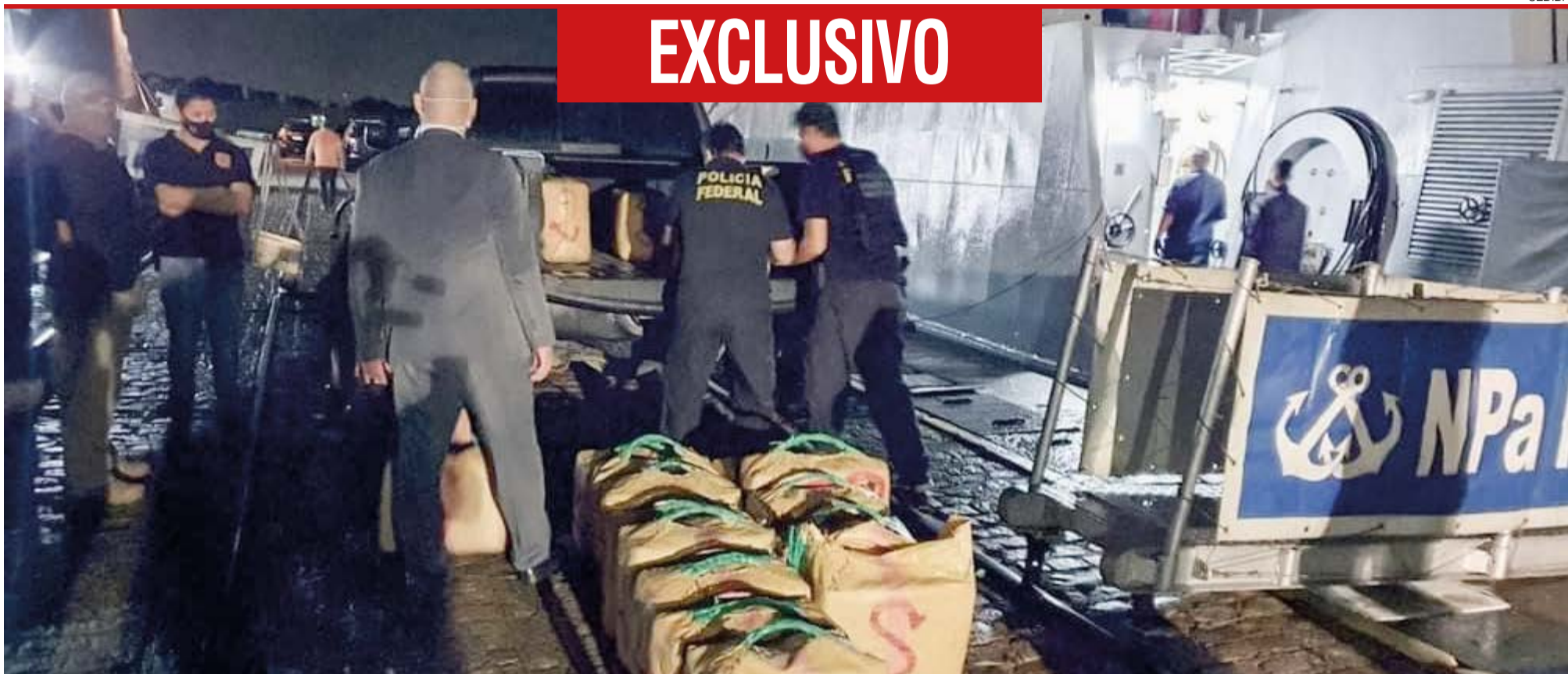
Polícia Federal e Marinha do Brasil apreenderam a embarcação que transportava a droga e era tripulada por dois italianos, que foram autuados em flagrante delito e estão à disposição da Justiça, em Natal